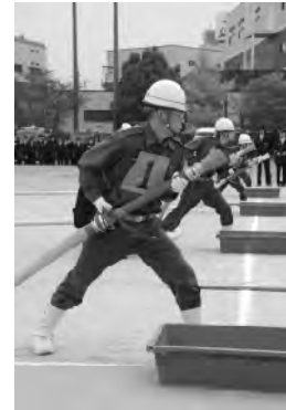
昨年の市消防団観閲式

地域防災の要として活躍している消防団員によるポンプ車操作や小隊訓練等、日頃の訓練の成果が披露されます。