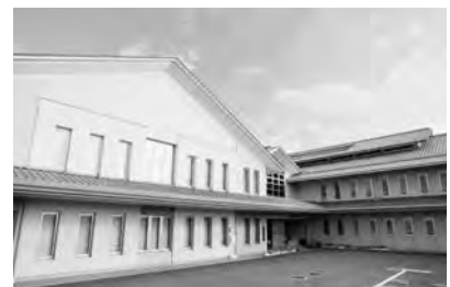
清洲総合福祉センター

■問合せ 清須市社会福祉協議会(清洲総合福祉センター内) 電話052-401-0031