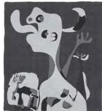
©Successo/Miro-Adaga, Paris & SPDA, Tokyo, 2010 《ENCANTADOR》1936

観覧料 | 一般：800円 高校・大学生：600円 小中学生：400円 未就学児：無料 各種障害者手帳提示者及び介添人1名様：半額