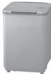
生ごみ処理機の例