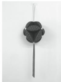
「七宝まり」を作ります

とき 4月8日(木) 午前9時30分から 定員 10名 材料費 500円 持ち物 針・糸・はさみ