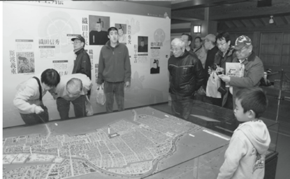
ジオラマを眺める来場者

展示内容を一新し、3月20日に清洲城がリニューアルオープンするのに先がけ、14日に市民を対象にした内覧会（無料）が行われました。オープニングセレモニーにおいて、出陣太鼓と能「幸若舞」が演舞された後、加藤市長のオープン宣言により内覧会がスタート。この日訪れた約1400人の来場者は、映像とジオラマで当時の城下町を再現したコーナーやNHK大河ドラマで使用した衣装の展示コーナーなどを興味深く眺めていました。