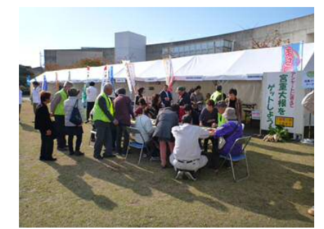
■農業体験イベント