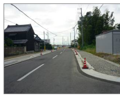
■市道下之郷六角堂線の整備