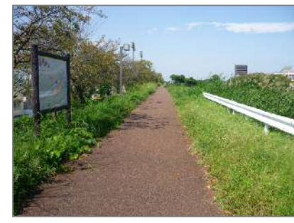
■水辺の散策路の整備