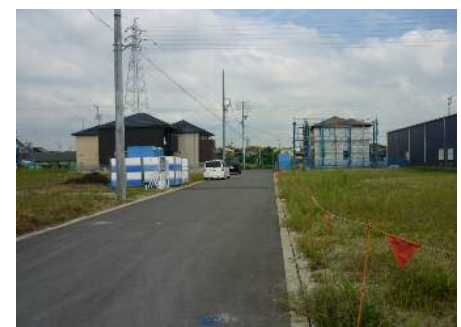
■土地区画整理事業