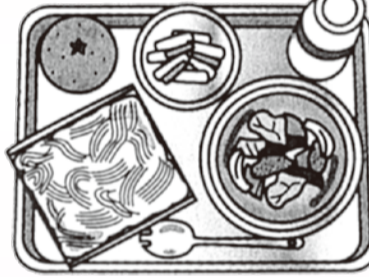
ソフトめん五目あんかけ・牛乳・甘酢あえ・みかん

パン以外の主食として、昭和38年ごろからソフトめん(ソフトスパゲッティ式めん)が導入されました。牛乳は昭和33年から一部地域で供給され、昭和39年に本格的な供給が始まりました。