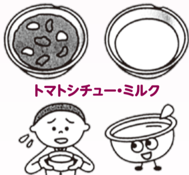
トマトシチュー・ミルク

LARA物資の脱脂粉乳や缶詰を使って、給食が作られました。ミルクは、牛乳から脂肪分を取り除いて乾燥させた「脱脂粉乳」をお湯で溶いたもので、独特な風味で苦手な子どもが多かったようです。