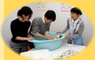
パパママ教室：沐浴体験