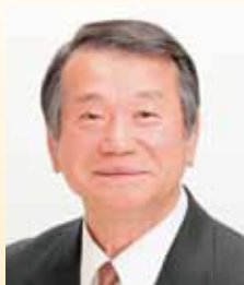
副議長 浅井 泰三